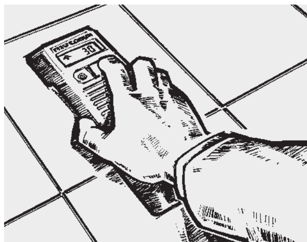
Jednoduchá nivelace díky jednotlačítkové obsluze (typické použití ručního přístroje)

Přístroj je tvořen kompaktním hadicovým bubnem se zápusťnými klikami, speciální hadicí a ručním přístrojem s displejem a jedním tlačítkem. Modul pro přesné měření, který je součástí ručního přístroje, měří rozdíl tlaku kapaliny mezi bubnem a ručním přístrojem.