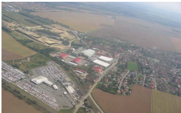
Tak tady jsme někde na západ od Prahy těsně po startu.